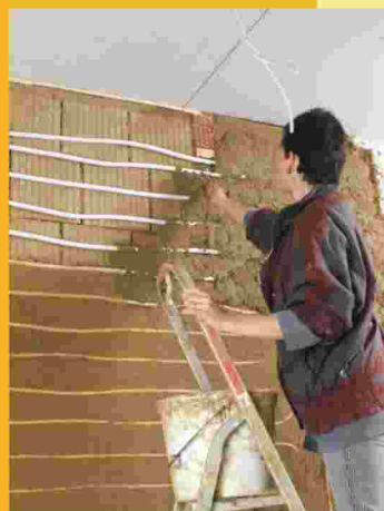
Verputzen der Wandheizung mit Lehmörtel Hervorragendes Raumklima durch Strahlungswärme