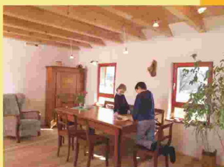
Lehmputz mit Kaseinfarbe gestrichen