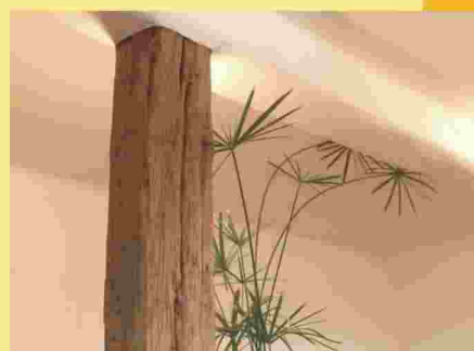
Vorhandener Holzunterzug mit Lehmputz Detail Beleuchtung