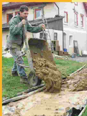
Einsumpfen des Lehms vom eigenen Grundstück als Verputzmaterial