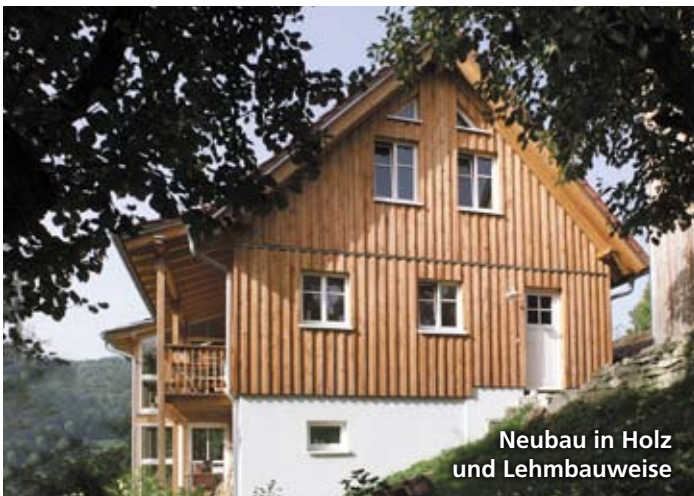
Neubau in Holz und Lehmbauweise