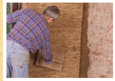
Sanierung mit Schilf und Lehm